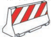
Barriera Alta Centrale