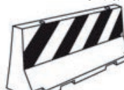
Barriera Alta Laterale